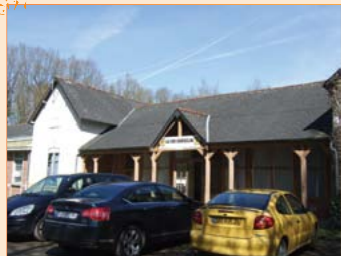
Un bâtiment historique accueille le stand de tir de La Dugesclin