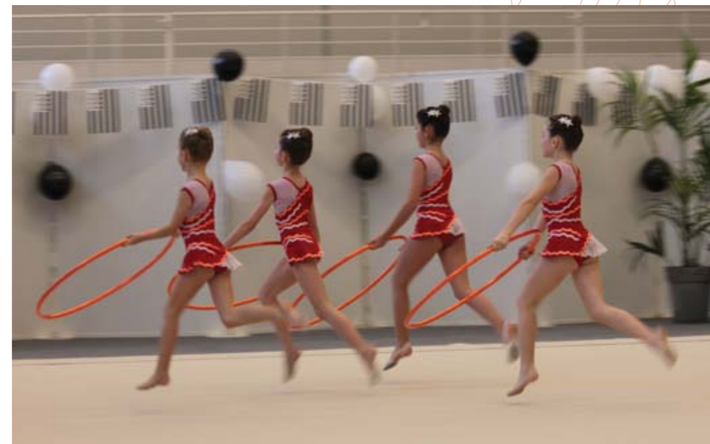
Les Championnats de Bretagne de gymnastique rythmique "ensemble" se sont déroulés à Rennes les 16 et 17 mars derniers. Une occasion pour les jeunes gymnastes du Cercle Paul Bert de se qualifier pour la finale de zone.

Plus d'informations : www.rennes-monostars.durab.fr