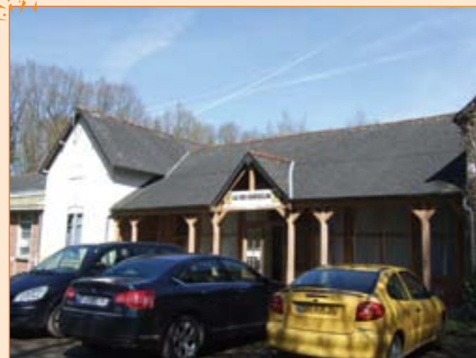
Un bâtiment historique accueille le stand de tir de La Dugesclin