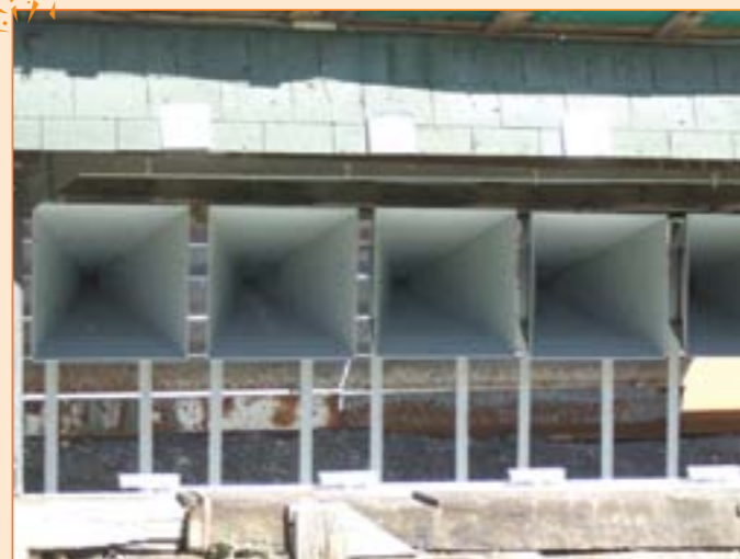
Les cônes récupèrent les projectiles