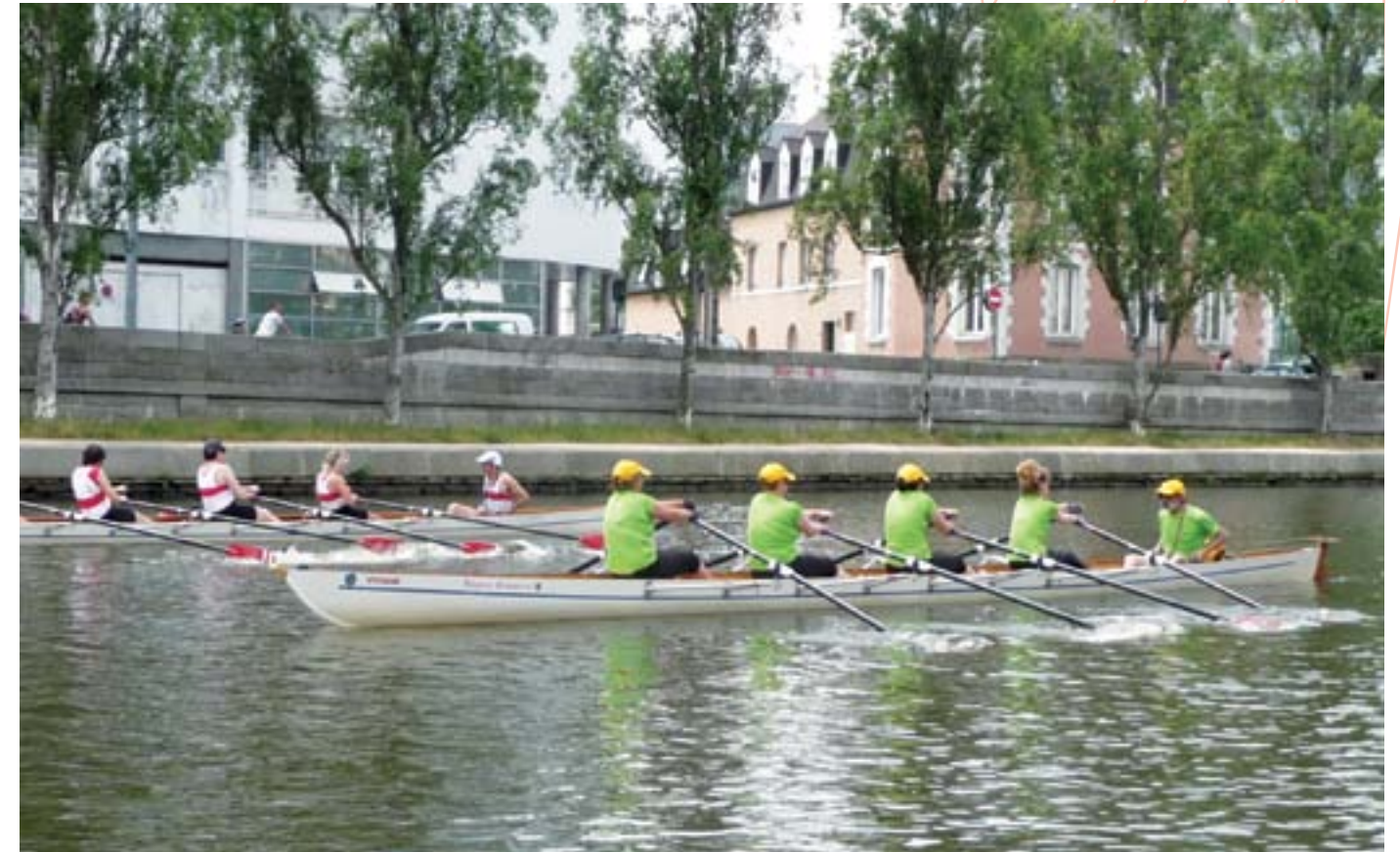
La Régate des poissons organisée par le REC Aviron en juillet dernier a rassemblé 16 équipages : 3 féminins, 6 masculins et 7 mixtes.

Plus d'informations : aeretatete@gmail.com