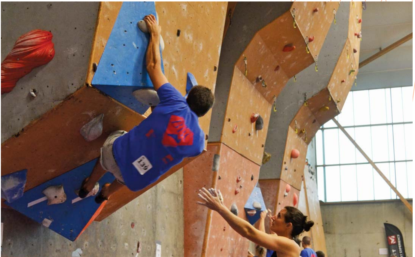
La 10 e édition de Vol de Nuit, le challenge de bloc de Bretagne, a été organisé par Vertical Ouest Loisir fin octobre à Rennes.