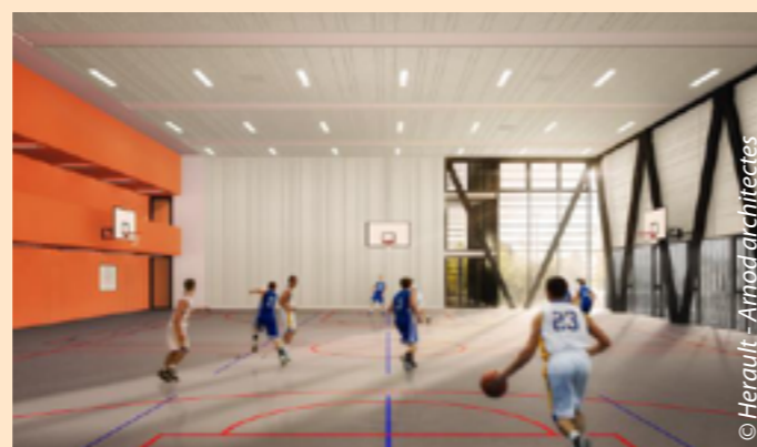
Le futur terrain de sport au 1 er étage de la Cité Internationale Paul Ricœur.

Enfin, un équipement sportif de trois salles viendra compléter l'ensemble du complexe : un dojo, un terrain de sport (basket, handball...) et une salle de gym et de danse, seront ouverts aux écoles et associations du quartier. Un vrai gymnase au cœur de Rennes pour le plaisir des Rennais.