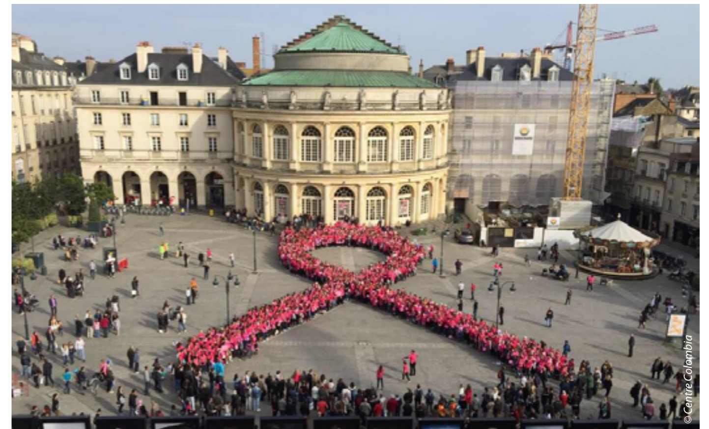
Les participants de la Colombia mobilisés contre le cancer du sein.